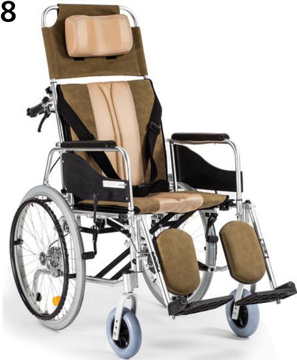
43 BK (šedý)