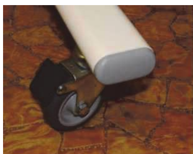
Kolečka 0,75 mm (2 x bez, 2 x s brzdami)