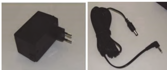
AC / DC nabíječka a propojovací