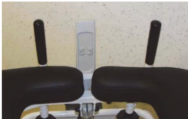
Obrázek 1: Zobrazení tlačítka pro nastavení výšky