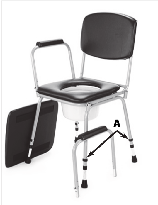
Umístění aretačních pojistek