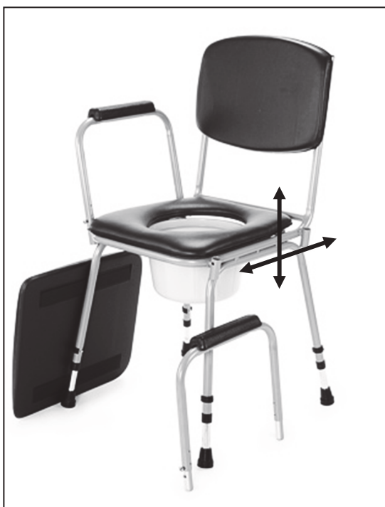
Vysunutí/zasunutí plastové nádoby

Pro použití křesla sundejte polstrovaný sedák a odstraňte víko plastové nádoby. Nádoby pak lze vysunout z držáků pod hygienickým prkénkem dozadu nebo vyjmout po odklopení prkénka horem. Po zmáčknutí pojistky (B) tahem nahoru velmi jednoduše vysunout madlo s područkou pro lepší nasedání.